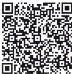
QR Code ๑ ยืนยันการเข้าร่วมอบรม