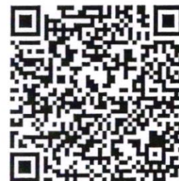
QR Code ๒ ตรวจสอบจำนวนผู้ชำระค่าลงทะเบียนแต่ละรุ่น